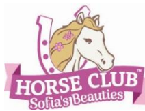
Tier Salon Art.-Nr.: 42614 UVP: 64,99 Euro Erhältlich ab 07/2023