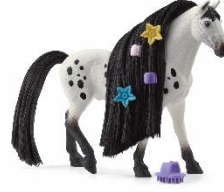
Beauty Horse Knabstrupper Hengst Art.-Nr.: 42622 UVP: 19,99 Euro Erhältlich ab 06/2023