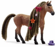
Beauty Horse Achal Tekkiner Hengst Art.-Nr.: 42621 UVP: 19,99 Euro Erhältlich ab 06/2023